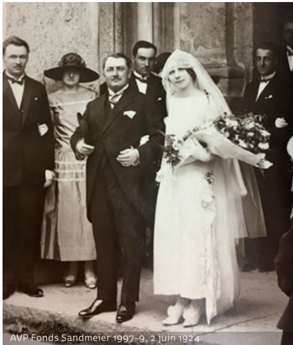
AVP Fonds Sandmeier 1997-9, 2 juin 1924